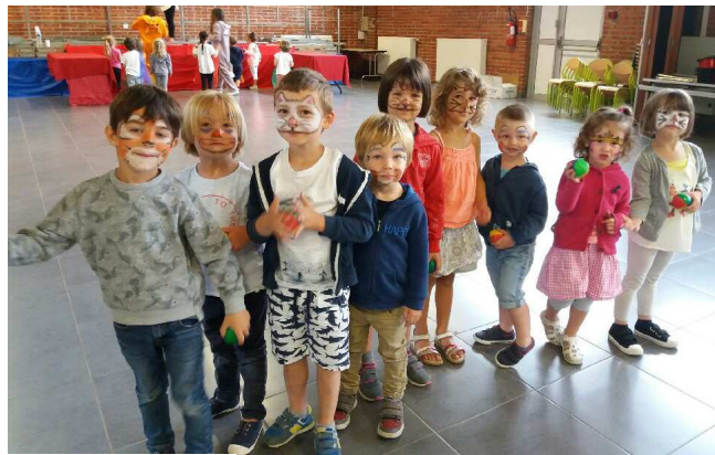
Le Centre de Loisirs en juillet