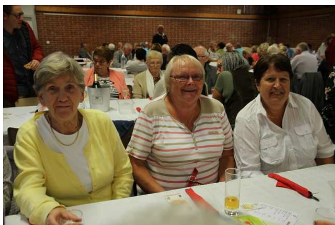
Moules – Frites