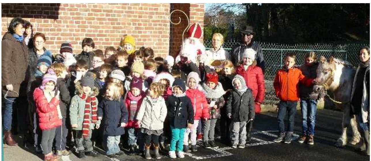
Saint Nicolas dans les écoles le 04/12