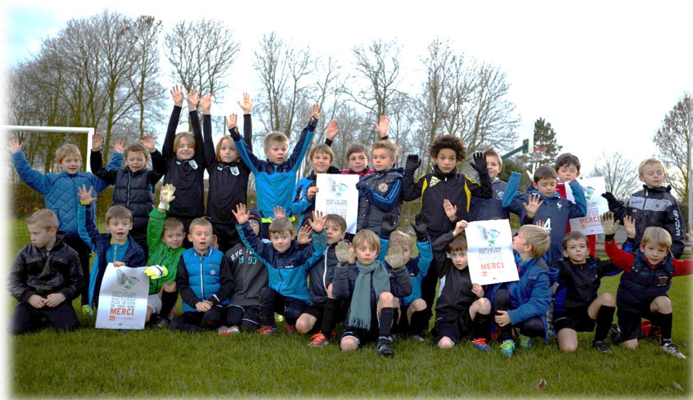
Jeunes joueurs de l'ECACTG

Bravo pour votre mobilisation, votre enthousiasme !