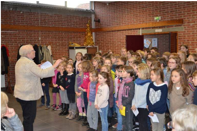
Goûter Inter-génération le 03/12