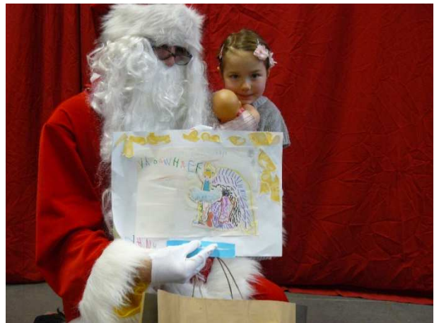
Arbre de Noël le 12/12