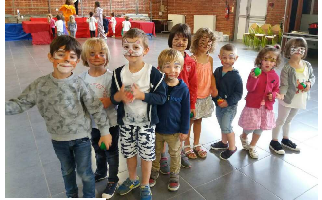
Le Centre de Loisirs en juillet