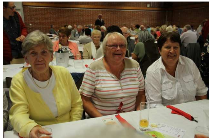
Moules – Frites