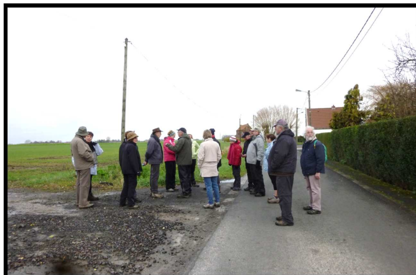
Grus'Rando à Wannehain le 03/01